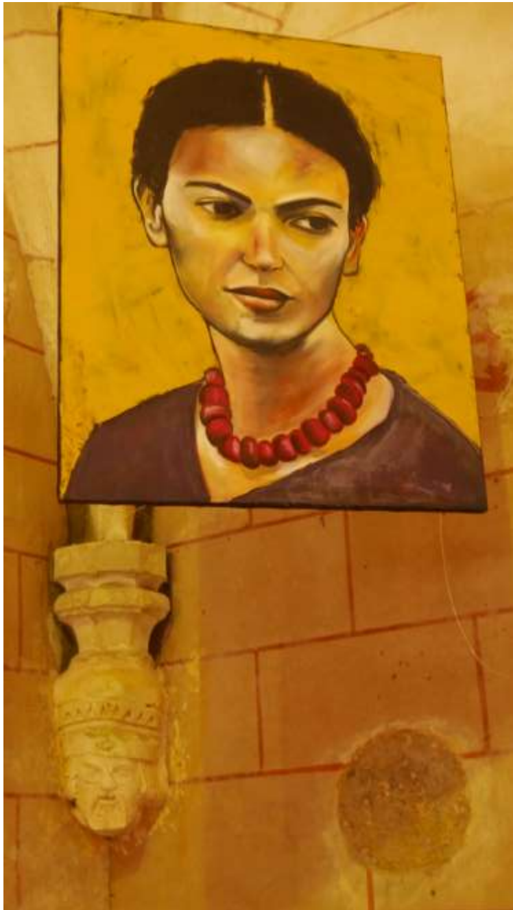
Art et Chapelles 2018