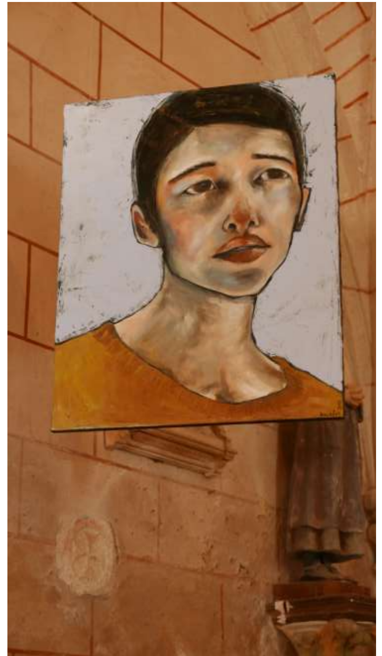
St Macaire du Bois