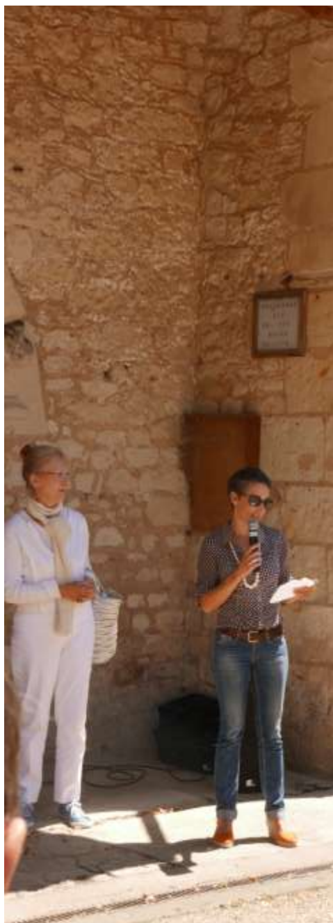
Art et Chapelles 2018

Mon travail part de l'intimité d'une rencontre.