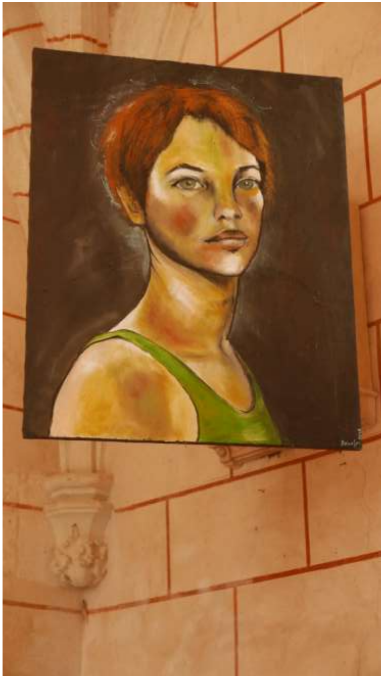
Art et Chapelles 2018