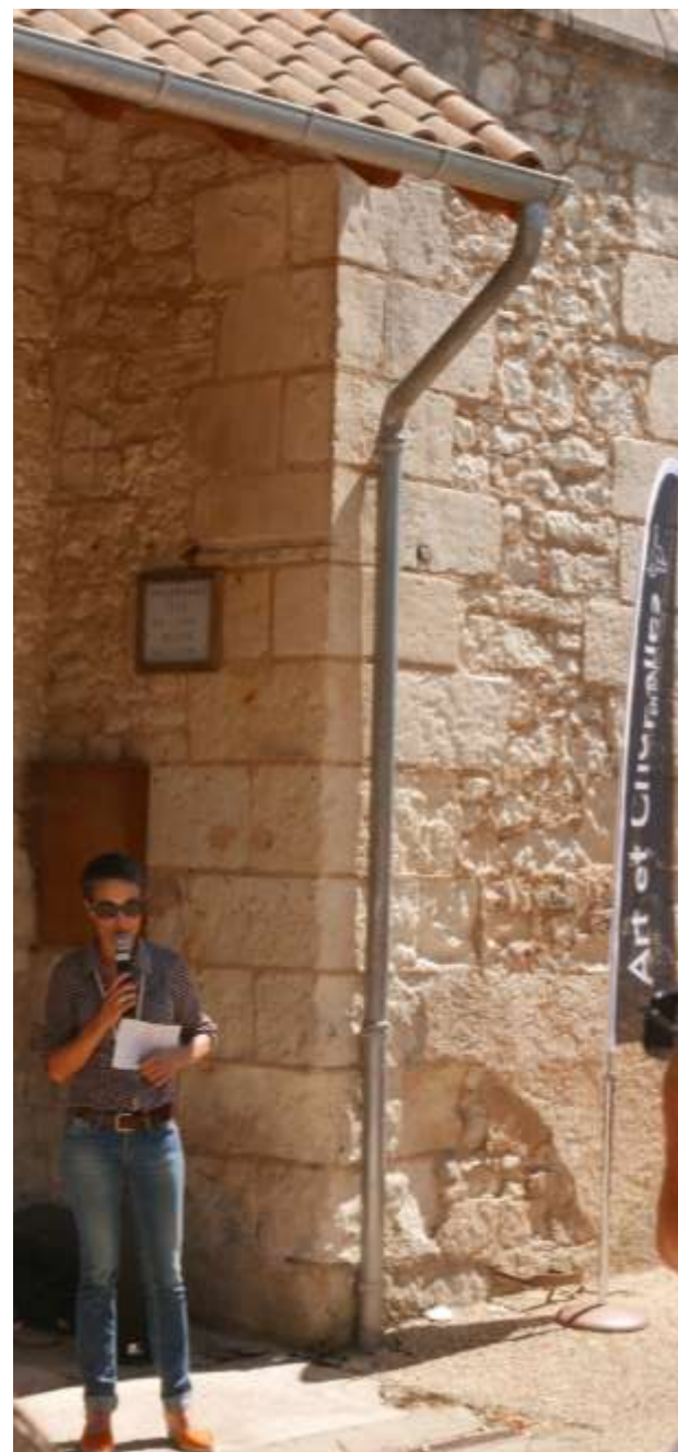
St Macaire du Bois