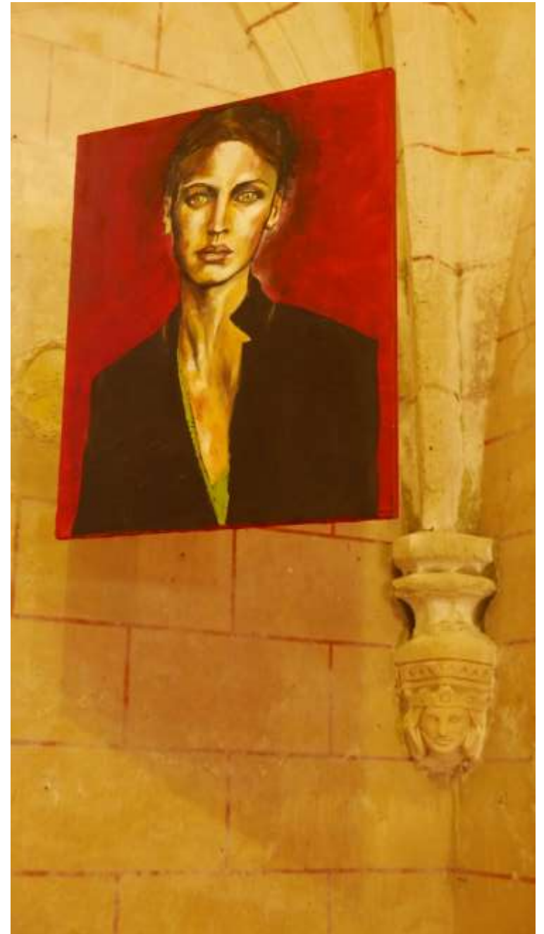
St Macaire du Bois