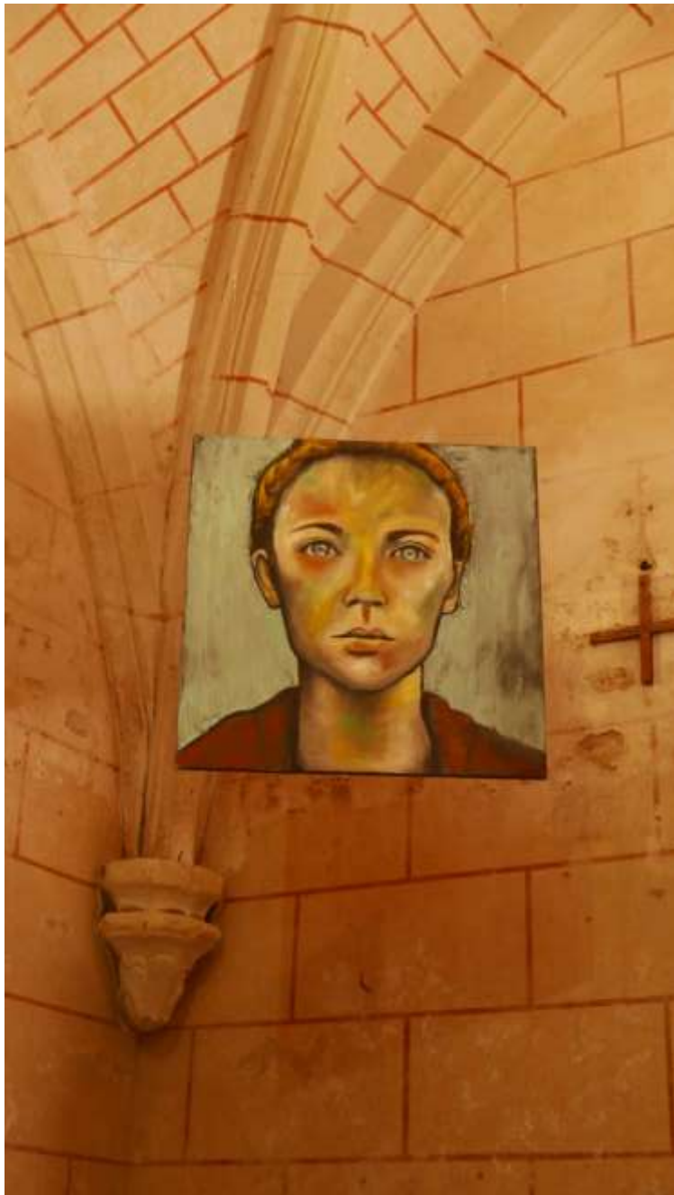
Art et Chapelles 2018